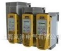
AC VARIABLE FREQUENCY DRIVES, HP RATED - AC30 SERIES